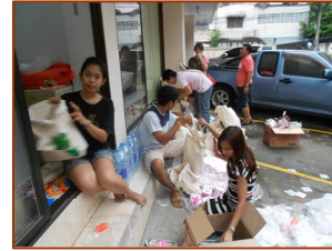
แพ็คของตั้งแต่ฝนไม่ตก จนฝนตก และ ฝนหยุด ทีมแพ็คของก็ไม่ท้อถอย