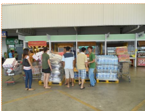
รอรถเพื่อนำของไปแจกต่อ