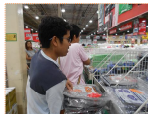
จัดหาซื้อของใช้ที่ชาวบ้านขอมมา