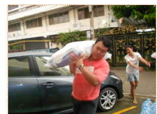
ขนย้ายของเตรียมแจก