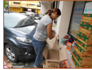
แบ่งหน้าที่เพื่อแพ็คของให้เร็วขึ้น