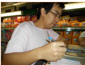
ประเมินราคาของต่อชุด

วันที่ 1 ตุลาคม 2554 เวลา 12.00 น. - 15.00 น. ชื่อของเพื่อไปช่วยเหลือพี่น้องผู้ประสบภัย