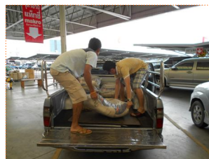
ขนย้ายของรอบที่ 1