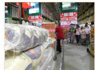
จำนวนของทั้งหมดที่จะนำไปแจกต่อชุด