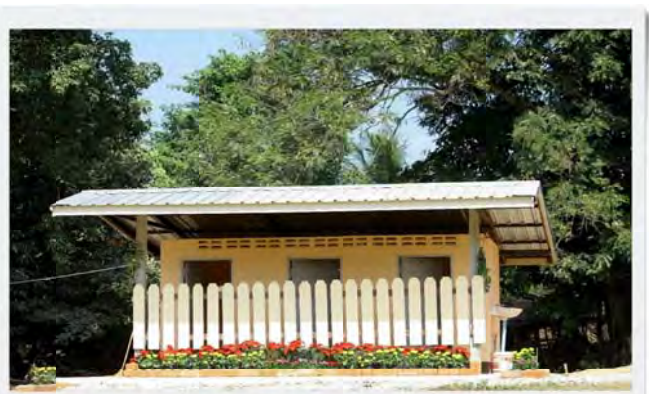
Sanfun Punroyyim # 7