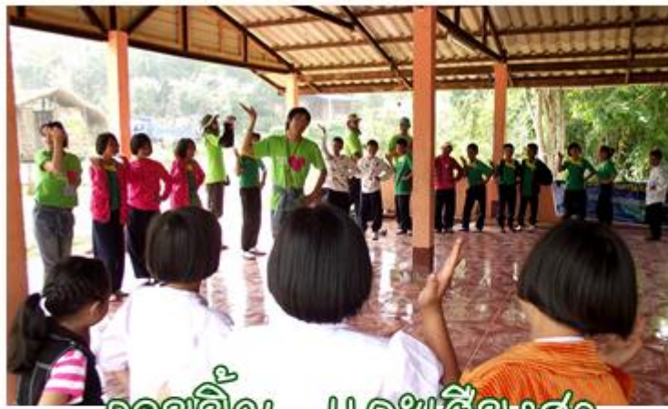
รถจักรยาน...และเสียงฮา