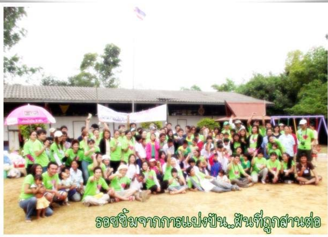
รอขงฉิมจากการแบ่งปัน..ฝันที่ถูกล่ามต่อ

ปีหน้าเจอกันอีกครั้งกับसानฝันปันรอยยิ้ม 5 ซึ่งจะไปสานฝันให้น้องๆ ที่โรงเรียนในถิ่นทรกัณดารภาคอีสานอีกครั้ง แต่จะเป็นโรงเรียนใดนั้น ยกให้เป็นหน้าที่ของฝ่ายสำรวจสถานที่จะไปหาข้อมูลมานำเสนอ.... ท่านใดสนใจกิจกรรมดีๆ แบบนี้หรืออยากร่วมบริจาค เตรียมไว้ได้เลยในช่วงเดือนธันวาคมปีหน้า กำหนดการและสถานที่ที่จะแจ้งให้ทราบอีกครั้ง...แต่สิ่งของบริจาคที่อยากได้ก็เช่นเดิม...ขอบคุณครับ