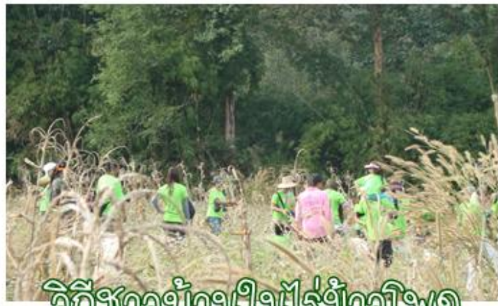
วิถีชาวบ้านไร่ไร่ข้าวโพด