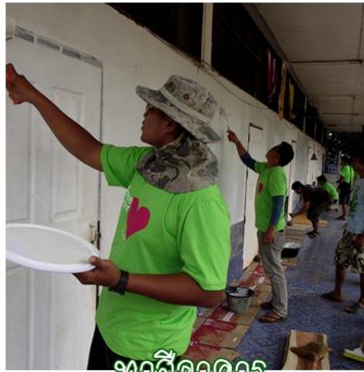
ทาสีอาคาร