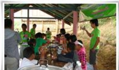
เลี้ยงอาหารกลางวัน