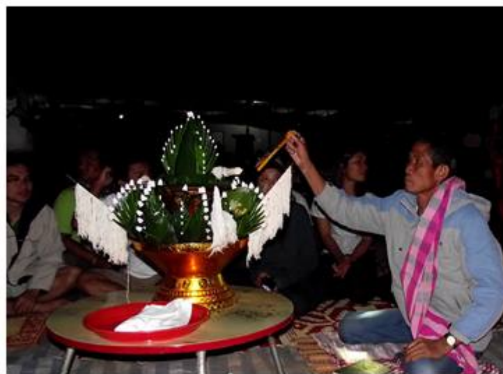
พิธีบายศรีสู่ขวัญ