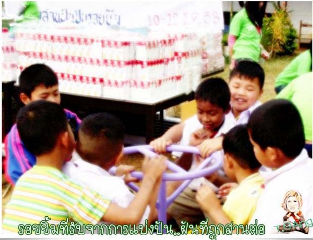
รอยยิ้มที่รับจากการแบ่งปัน..พื้นที่ถูกส่วนต่อ