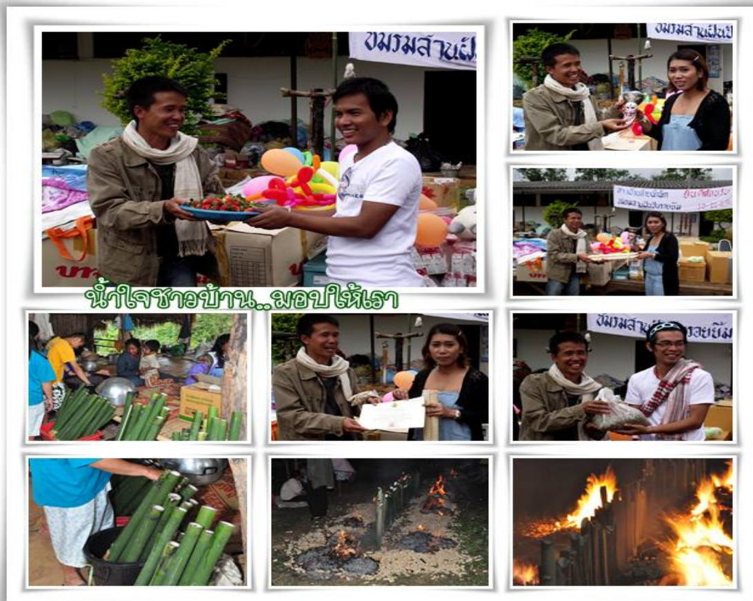
น้ำใจเราชาวบ้าน..มอบให้เธอ