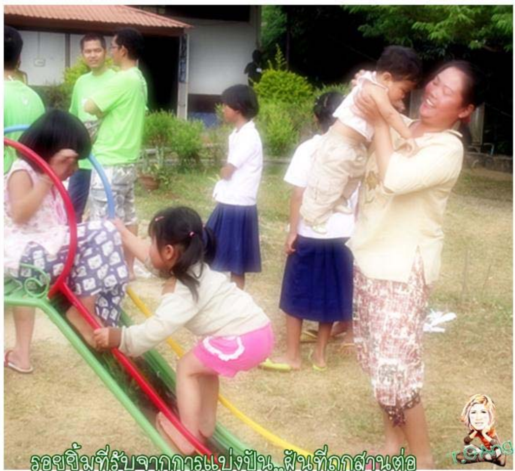
รอยยิ้มที่รับจากการแบ่งปัน..พื้นที่ถูกส่วนต่อ